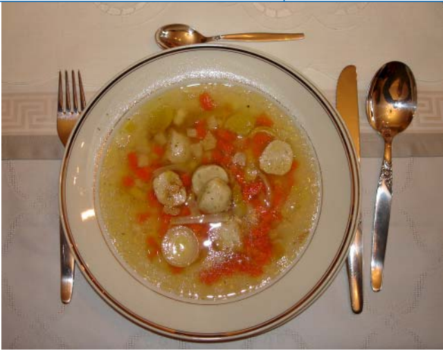
Abb. 2 ◀ Vorsuppe mit Einlage

quaten Zerkleinerung von Spargelstangen, welche in der längsten Zeit des 20. Jahrhunderts durchaus noch von gesellschaftlichem Interesse waren, werden heute allenfalls innerhalb sozialer Randgruppen gestellt (▣ Abb. 4). Dagegen sind die Unterschiede zwischen Wohlstand und Essqualität fast nirgends in Europa so augenfällig wie in Deutschland. Besonders deutlich zeigt sich dies bei der technischen Ausstattung der Küchen. Das Geschäft mit Induktionsherden, Riesenkühlschränken und Luxusmessern boomt, während im Topf Minderwertiges brutzelt. Denn gekauft wird, was billig ist, gut aussieht und die Gesundheit nicht gefährdet. Dies stößt inzwischen selbst bei Engländern auf Unverständnis.