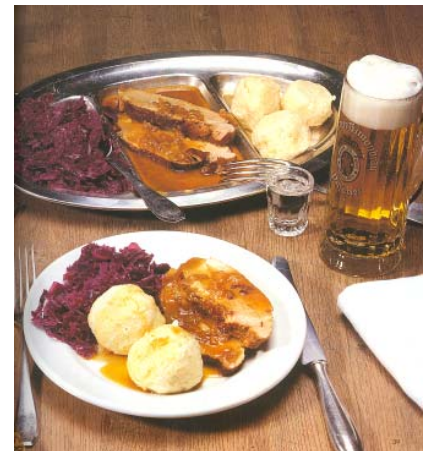
Abb. 1 ▲ Die gutbürgerliche Küche mit Tradition: ein Auslaufmodell?

Bearbeitete Fassung eines Vortrags anlässlich des Symposiums „Warum essen Menschen anders als sie sich ernähren?“ am 31.03.2007 in Göttingen.