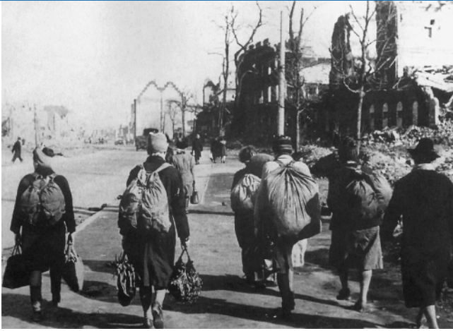
Abb. 5 ◀ Kölner Frauen haben im ländlichen Umland Lebensmittel gehamstert . Mit vollen Rucksäcken kehren sie im März 1946 heim

tigsten Überlebensstrategie (▣ Abb. 5 ). Vor allem der Winter 1946/47 brachte extreme Härten, und man sprach sogar vom 8. Kriegswinter ; denn es war außergewöhnlich kalt, und sowohl die Industrie als auch die Energieversorgung brachen zusammen. Das Zusammenwirken von Kälte und Unterernährung forderte in Deutschland ungefähr 20.000 Todesopfer.