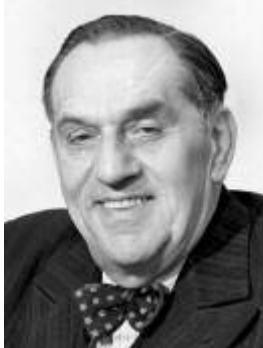
Professor Dr. Wilhelm Niklas (CSU)

Bundesministerium für Ernährung, Landwirtschaft und Forsten (vom 20.09.1949 bis 12.01.2001)