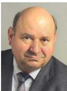
Ignaz Kiechle (CSU) Landwirtschaftsmeister (1930 – 2003) vom 30.03.1983 bis 21.01.1993