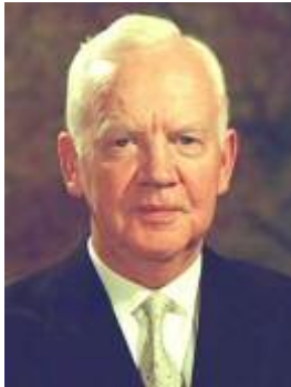
Heinrich Lübke (CDU)