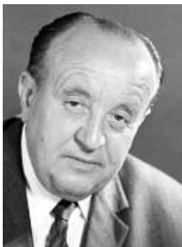
Hermann Höcherl (CSU)

Diplom-Landwirt (1900 – 1982) vom 14.10.1959 bis 26.10.1965