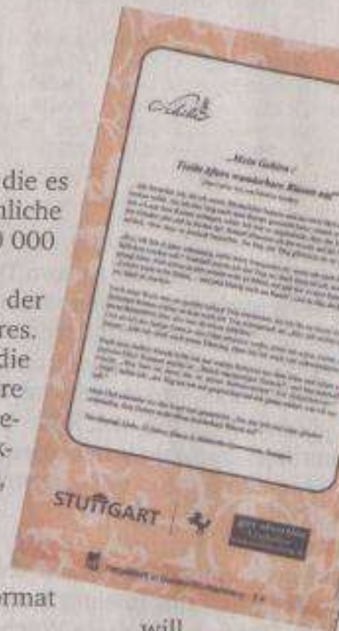
Marbacher Zeitung am 25.8.2009 zur "Bäckertüten Lesung" in der Schillerlaube

will nei“ aus „Die Ver beginnt, war für Bäckertüte, die gruppe anspricht Da heißt es am S ich das Messer he eigentlich ganz g dem Hemd“. Ach einen Berliner.