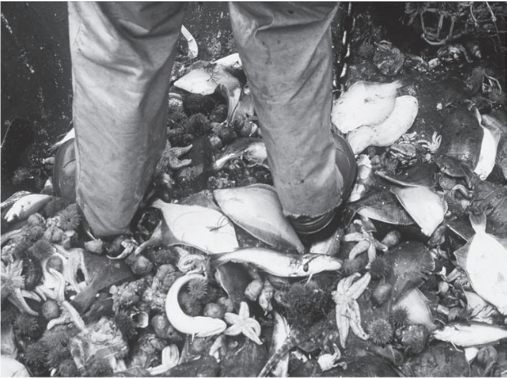
Neben den Zielarten gehen den Fischern auch viele andere Meerestiere als Beifang ins Netz.

weile dringen die Schleppnetzfischer in die Tiefsee vor, wo besonders empfindliche Ökosysteme wie Kaltwasserkorallenriffe Heimat für viele bis heute unbekannt Arten bieten. In der Tiefe findet das Leben in Zeitlupe statt und die Tiere wachsen dort nur sehr langsam, vermehren sich spät und haben nur sehr wenige Nachkommen. Das macht sie besonders anfällig für die Überfischung.