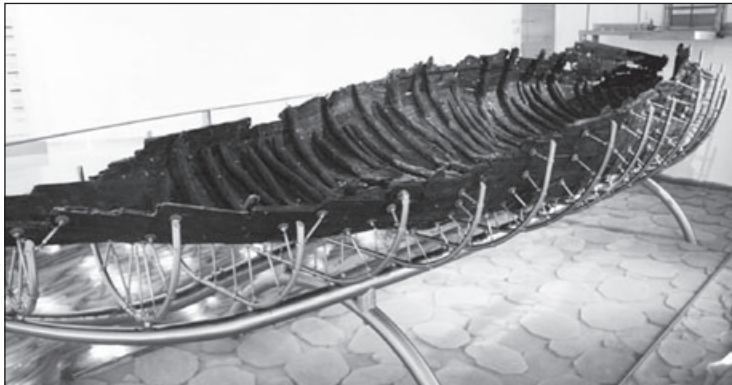
Fischerboot aus dem See Genezareth aus der Zeit Jesu, das sogenannte „Jesus-Boot“. Fischer entdeckten es im Jahr 1986 im Uferschlick. Wissenschaftler konnten es anhand von Holznägeln als 2000 Jahre alt datieren, seine Überreste sichern und im Yigal-Allon-Museum im Kibbuz Ginnossar ausstellen.

Der Fisch wurde ohne Zweifel zu einem wichtigen und aussagekräftigen Symbol in der frühen Christenheit. Immer wieder wird in neuerer Zeit erzählt, dass