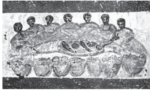
Eucharistisches Mahl mit Brot und Fisch, Calixtus-Katakombe, frühes 3. Jh. n. Chr.