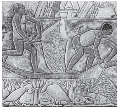
Das Fischfangen mit Hilfe eines Handnetzes, Wandmalerei im Grab des Mereruka, Sakkara, Ägypten

Ein ideales Brutgebiet für Fisch ist noch heute der Hulesee und der südlich davon gelegene Hulesumpf, der erst im 20. Jahrhundert teilweise trocken gelegt wurde