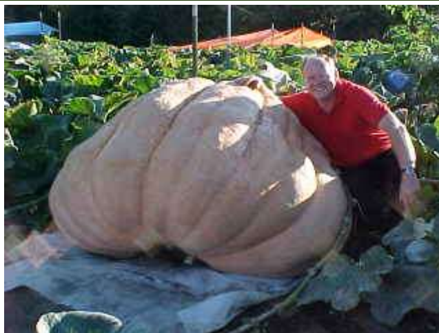
1420.5 Pound Pumpkin

If you need help understanding how to grow one of these mammoths, I have listed several homepages and books to assist you. With all my secrets , you to can grow that 1000 pound pumpkin this year.