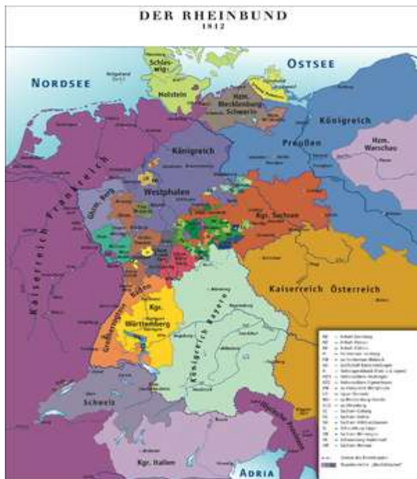
Politische Karte 1812: Kaiserreich Frankreich an Nord- und Ostsee

Eine weitere Kehrseite der Blockadepolitik war das Aufblühen des Schmuggels . Im Handelskrieg mit Großbritannien versuchte Napoléon Bonaparte daher soviel wie möglich von den Küstengebieten in seine mittelbare oder unmittelbare Herrschaft zu bekommen. Im Vertrag zwischen Holland und Frankreich vom 16. März 1810 musste ersteres ganz Seeland mit der Insel Schouwen , Brabant und Geldern auf dem linken Ufer der Waal abtreten. Am 1. Juli 1810 wurde der König von Holland , Ludwig Bonaparte , zur Niederlegung seiner Krone gedrängt, was anschließend durch das Dekret vom 9. Juli 1810 die Vereinigung des Königreiches Holland mit Frankreich nach sich zog. Da britische Importe weiterhin den Kontinent erreichten, erklärte der französische Kaiser, dass er die ganze Küste der Nordsee unter seine Aufsicht nehmen müsse. Am 13. Dezember wurden Gebiete an den Mündungen der Ems , Weser und Elbe nebst den Hansestädten Bremen , Hamburg und Lübeck von Frankreich annektiert. [1] Napoleon missachtete mit der Integration des Herzogtums Oldenburg , des Herzogtums Arenberg und des Fürstentums Salm die bestehende Rheinbund-Akte . [2]