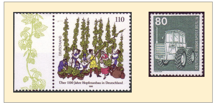
v.l.: Abb. 25 und 26

Den 100. Todestag des Gründers der Genossenschaftsbewegung in Deutschland und Sozialreformers Friedrich Wilhelm Raiffeisen würdigte die Bundespost 1988 mit einer Sondermarke, auf der sein Porträt vor einem bestellten Feld abgebildet ist. Bereits in der Wohlfahrtsserie von 1958 (Abb. 23), die sowohl in der Bundesrepublik als auch im Saarland, allerdings in Franc-Währung, erschien, ist eine Marke mit dem Raiffeisen-Porträt enthalten. Die übrigen Werte dieser Serie sind den bäuerlichen Berufen gewidmet und zeigen eine Sennerin, eine Winzerin und einen Bauern mit einer Heugabel.