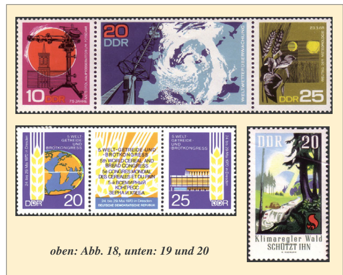
oben: Abb. 18, unten: 19 und 20

Die Ausgaben zu internationalen wissenschaftlichen Kongressen in der DDR und anlässlich Welttagen, die mit der Landwirtschaft verbunden waren oder sie tangierten, erfolgten als Zusammendrucke mehrerer Marken. Das betrifft z.B. die Ausgabe anlässlich des Welttages der Meteorologie mit einer Marke, auf der ein Getreidefeld bei Tag und Nacht zu erkennen ist (Abb. 18), oder die Ausgabe zum Welt-Getreide- und Brotkongress 1970 in Dresden, mit der Abbildung von Ähren vor der Weltkugel und dem Tagungsort des Kongresses (Abb. 19).