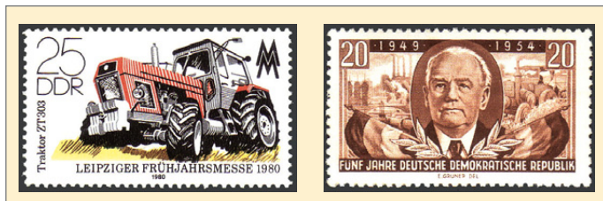
v.l.: Abb. 16 und 17

Eindrucksvoll ist die Palette von Briefmarken mit Traktorenmotiven. Die ersten in der DDR gebauten Schleppertypen, wie der RS 01 „Pionier“, der RS 04/30 sowie der „Famulus“ sind als Zugmittel der bereits genannten Landmaschinen auf den Ausgaben bis etwa 1970 zu erkennen. Dagegen findet man die in den 50er Jahren gebauten Kettenschlepper „Rübezahl“ und „Urtrak“ nur im Hintergrund der Ausgaben zur Jugendweihe 1959 und zur Volksarmee 1962. Abbildungen des ab Ende der 60er Jahre gebauten ZT 300, der zum Standardtraktor des Traktorenbaues der DDR wurde, sind auf einer Reihe von Briefmarkenausgaben zu finden. Am eindrucksvollsten ist er auf der Marke mit der Hochdrucksammelpresse zu sehen (Abb. 15). Zur Leipziger Messe 1980 wurde mit der Abbildung eines ZT 303 die Allradversion des ZT 300 (Abb. 16) vorgestellt. Seine ab 1984 verbesserte Variante, der ZT 323, ist als Motiv auf den Ausgaben zu den 23. Arbeiterfestspielen 1986 und zum 35. Jahrestag der LPG 1987 zu erkennen.