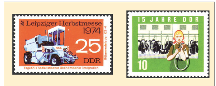
v.l.: Abb. 12 und 13

Gerade mit dieser Ausgabe wurde besonders für den Export von Landtechnik geworben. Weitere Beispiele für die Widerspiegelung der Entwicklung der Landtechnik lassen sich auch an Hand der Erntetechnik für Zuckerrüben und der Melktechnik zeigen. So wurde in einer Ausgabe zur Landwirtschaftsausstellung 1958 eine Rübenvollerntemaschine zum Motiv einer Marke gewählt. Während mit dieser Maschine noch das Blatt und die Körper der Zuckerrübe auf dem Feld abgelegt wurden, erfolgte durch den auf einer Marke zur Leipziger Messe 1974 abgebildeten Rübenrodelader KS-6 Roden und Abtransport der Rüben in einem Arbeitsgang (Abb. 12), während das Köpfen und der Abtransport des Blattes durch eine weitere selbstfahrende Maschine erledigt wurden.