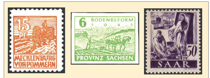
v.l.n.r.: Abbildung 4 bis 6

Auch in den Ländern der sowjetischen Besatzungszone wurden in den Jahren 1945 und 1946 Briefmarken mit landwirtschaftlichen Motiven herausgegeben. Vor allem unter den Marken aus Mecklenburg-Vorpommern gibt es eine Vielzahl derartiger Motive. Allein von den drei Motiven der 1. Dauerserie sind zwei der Landwirtschaft gewidmet, das Motiv des „Pflügers“ und das Motiv mit der Getreidegarbe vor dem Bauernhaus. Die Sondermarken der Serie zur Bodenreform „Junkerland in Bauernhand“ haben ebenfalls die Arbeit des Bauern als Motiv, als „pflügender Bauer“, „Sämann“ und „Schnitter“. Und schließlich sind von den elf Motiven der letzten Dauerserie, der sogenannten Abschiedsserie, allein sechs Motive mit landwirtschaftlicher Thematik. Besonders hervorgehoben werden soll dabei der Wert mit dem pflügenden Traktor, die erste Abbildung eines Traktors auf einer deutschen Briefmarke (Abb. 4). Der Bodenreform widmete auch die Post der Provinz Sachsen eine Sonderausgabe. Sie zeigt einen pflügenden Bauern vor der aufgehenden Sonne (Abb. 5).