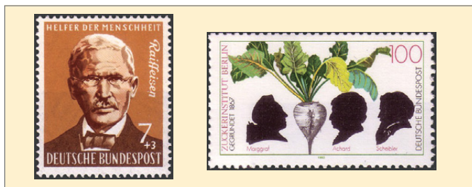
v.l.: Abb. 23 und 24

Im Jahre 1953 gedachte die Deutsche Bundespost des Chemikers Justus von Liebig mit seinem Porträt auf einer Ausgabe. Wenige Jahre später war der 350. Jahrestag der Ludwigs Universität / J. v. Liebig Hochschule erneut Anlass, den Chemiker zu ehren. Im Markenbild wurde die Frontalansicht seines damaligen Laboratoriums abgebildet. In der DDR wurde im Rahmen der Ausgabenreihe „Bedeutende Persönlichkeiten“ die Bedeutung der Arbeiten von J. v. Liebig für die Landwirtschaft hervorgehoben (Abb. 22). Das Markenbild dieser Ausgabe zeigt sein Porträt und über Ähren eine Retorte mit den Buchstaben N, P und K, den Bezeichnungen der von ihm entdeckten wichtigsten Pflanzennährstoffe. Zu seinem 200. Geburtstag im Jahr 2003 kam erneut eine Briefmarke mit seinem Porträt und den Abbildungen einer chemischen Apparatur sowie Dose mit Fleischextrakt zur Ausgabe, mit der offensichtlich die Vielseitigkeit des Wirkens des Chemikers hervorgehoben werden sollte.