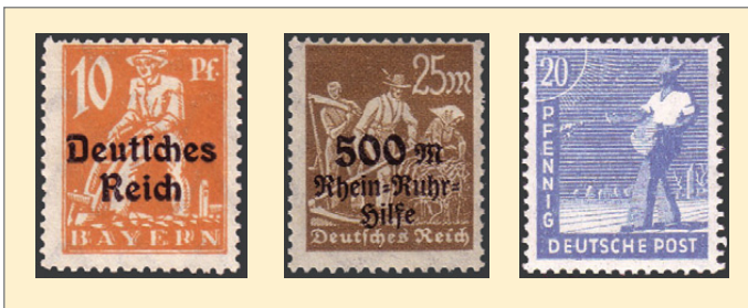
v.l.n.r.: Abbildung 1 bis 3

F ür die Rolle und Stellung eines Wirtschaftszweiges in der Volkswirtschaft eines Staates gibt es eine Vielzahl von Kriterien. Hier sollen als Beispiel nur seine Anteile am Bruttosozialprodukt, am Inlandsverbrauch und am Export erwähnt werden. Die Landwirtschaft und die Ergebnisse der Arbeit der Bauern zur Erzeugung des täglichen Brotes der Bevölkerung spielen dabei eine untergeordnete Rolle.