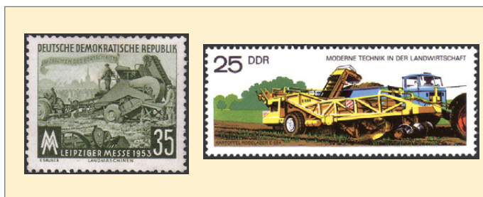
v.l.: Abb. 10 und 11

Im selben Jahr wie die Dauerserie „Fünfjahrplan“ erschienen Sondermarken zur Leipziger Herbstmesse. Auf einer dieser Marken ist eine Kartoffelvollerntemaschine zu erkennen (Abb. 10). Auch die Entwicklung der Technik für die Kartoffelernte lässt sich an Hand weiterer Ausgaben demonstrieren. So enthielt der Satz Sondermarken zum 10. Jahrestag der Volksarmee eine Marke mit dem Motiv einer Vollerntemaschine und auch eine Marke der Ausgabe „Moderne Technik in der Landwirtschaft“ zeigt den Kartoffel-Rodelader E 684 (Abb. 11) im Einsatz.