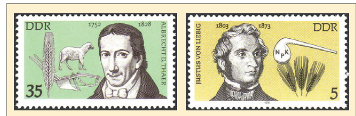
v.l.: Abb. 21 und 22

Landwirtschaftliche Nutztiere sind nur selten auf DDR- Ausgaben zu finden. Lediglich eine Marke der Serie zur 6. Landwirtschaftsausstellung zeigt eine Hochleistungskuh und im Zusammenhang mit den Abbildungen von Stallanlagen und der Melktechnik sind Rinder zu erkennen. Im Jahr 1979 gelangte eine Serie mit Motiven von Geflügelrassen zur Ausgabe. Die Serien anlässlich der Internationalen Kongresse für Pferdezucht enthielten vor allem Motive mit Sportpferden und nur wenige Marken mit Arbeitspferden. Der Forstwirtschaft wurden zwei Serien gewidmet. Eine aus dem Jahr 1969 beinhaltet den Schutz des Waldes (Abb. 20). Die andere zum Thema Jagdwesen von 1977 hat vor allem jagdbare Tiere zum Motiv.