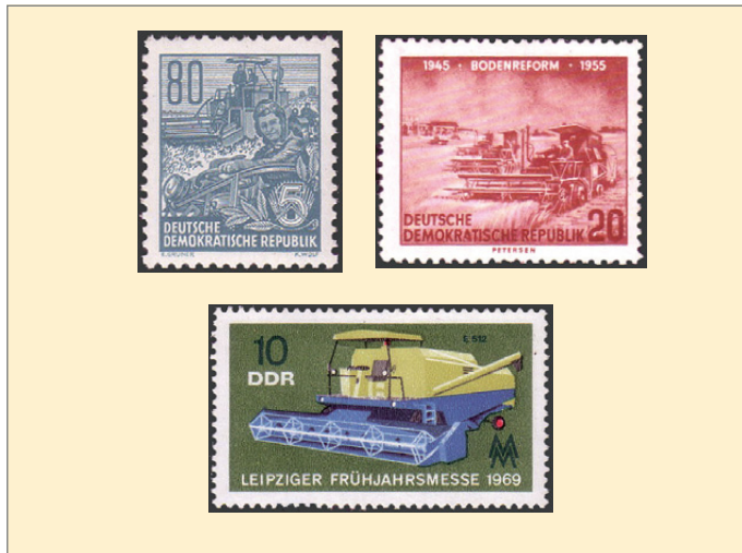
oben v.l.: Abb. 7 und 8, unten: Abb. 9

Das beginnt bereits mit der Dauerserie „Fünfjahrplan“ im Jahr 1953. Auf einer Marke dieser Serie ist ein offensichtlich gezogener Mähdrescher (Abb. 7) zu erkennen. Bereits zwei Jahre später bilden selbstfahrende Mähdrescher das Motiv für eine Marke zum 10. Jahrestag der Bodenreform (Abb. 8). Auch die Ausgaben anlässlich des 10. Jahrestages der DDR 1959, der 10. Landwirtschafts-Ausstellung in Markkleeberg 1962 sowie zum 7. Parteitag der SED 1967 haben Mähdrescher aus der eigenen Produktion, meist vom Typ E 175, als Motiv. Auf der Ausgabe zur Leipziger Frühjahrsmesse 1969 wird der Mähdrescher E 512 vorgestellt (Abb. 9). Auf einer der Marken zum 40. Jahrestag der DDR ist der Mähdrescher E 516 abgebildet.