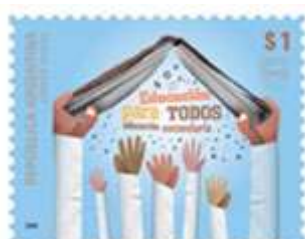
Viñeta: Educación secundaria. Libro abierto a modo de techo de una escuela que alberga a alumnos. Sus manos

Fecha de emisión: 12 de Septiembre de 2009