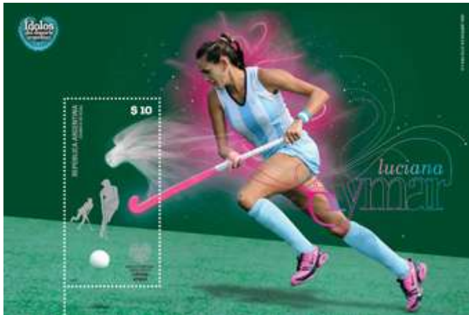
Viñeta: Luciana Aymar – Hockey Sobre Césped.