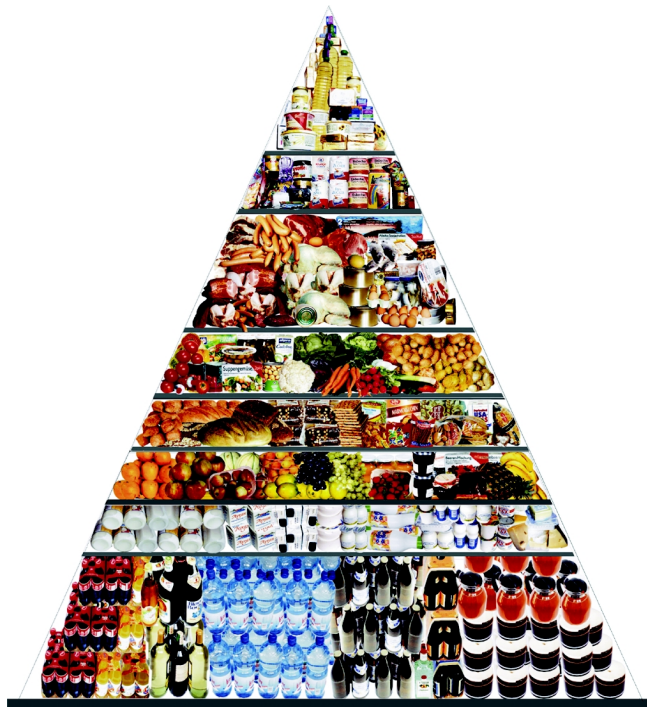
Abb. 1: Ernährungs-Pyramide

Die Ernährung nimmt einen großen Teil gesellschaftlichen Handelns ein. Etwa ein Fünftel der vorhandenen Ressourcen (Zeit, Material, Geld) werden dafür sowohl aus individueller als auch aus gesellschaftlicher Sicht beansprucht. Nachgefragt wird nach einer Vielzahl verschiedener Lebensmittel. Der gegenwärtige Lebensmittelmarkt bietet mehr als 230.000 verschiedene Artikel einerseits zur Befriedigung dieser Nachfrage an, andererseits aber auch, um ständig neue Bedürfnisse zu wecken. Vergleichsweise Bescheiden sind dagegen die Mittel, die für die Ernährungsforschung ausgegeben werden.