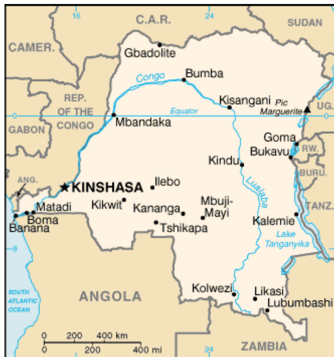
Markiert: rohstoffreiche Gebiete im Osten des Landes Graphik erstellt von J. Dallmer auf Basis von Wikipedia commons

Kongo könnte vielleicht das reichste Land Afrikas sein. Kein Land hat so große und wertvolle Rohstoffvorkommen wie der Kongo. Doch von 1996-2003 herrschte ein blutiger Bürgerkrieg, der ca. 4 Millionen Menschen das Leben kostete. Ein Hauptgrund für den Konflikt war der Zugang zu den Rohstoffen im Osten des Landes, denn der Kongo war und ist ein großer Exporteur von Tantal-Erz. Im Norden des Landes, in dem sich die Tantal-Mienen befinden, kämpften verschiedene Rebellen-gruppen miteinander. Diese finanzieren ihren Krieg über den Verkauf des Minerals.